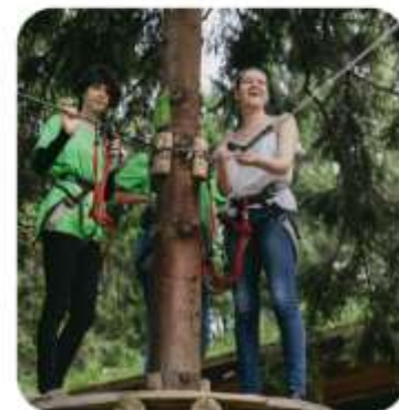
«ПОХОДЫ ПЕРВЫХ- БОЛЬШЕ, ЧЕМ ПУТЕШЕСТВИЕ»