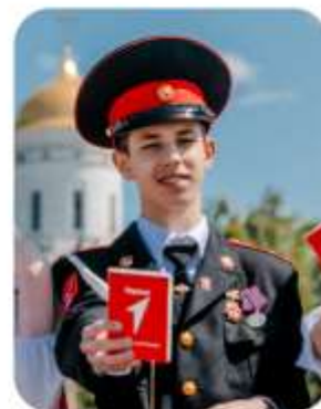
«МЫ – ГРАЖДАНЕ РОССИИ!»